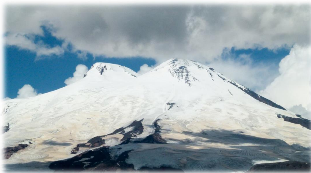
Рис.9 – Вид на Эльбрус с Чегета.