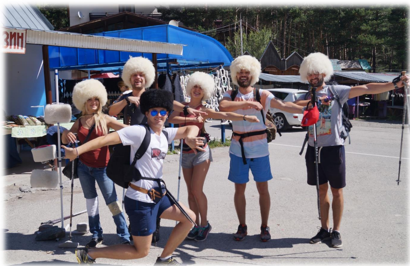
Рис. 19 – Рынок у подножья горы Чегет.

Резервный день, на случай, если погода решит внести свои коррективы в наши планы. Если же всё пройдёт гладко, то этот день можно посвятить увлекательным экскурсиям на водопады, в ущелья и не менее увлекательному багажеутяжелению за счёт купания магнитов, кавказских специй, носков из овечьей шерсти, платков из козьего пуха на местном сувенирном базаре.