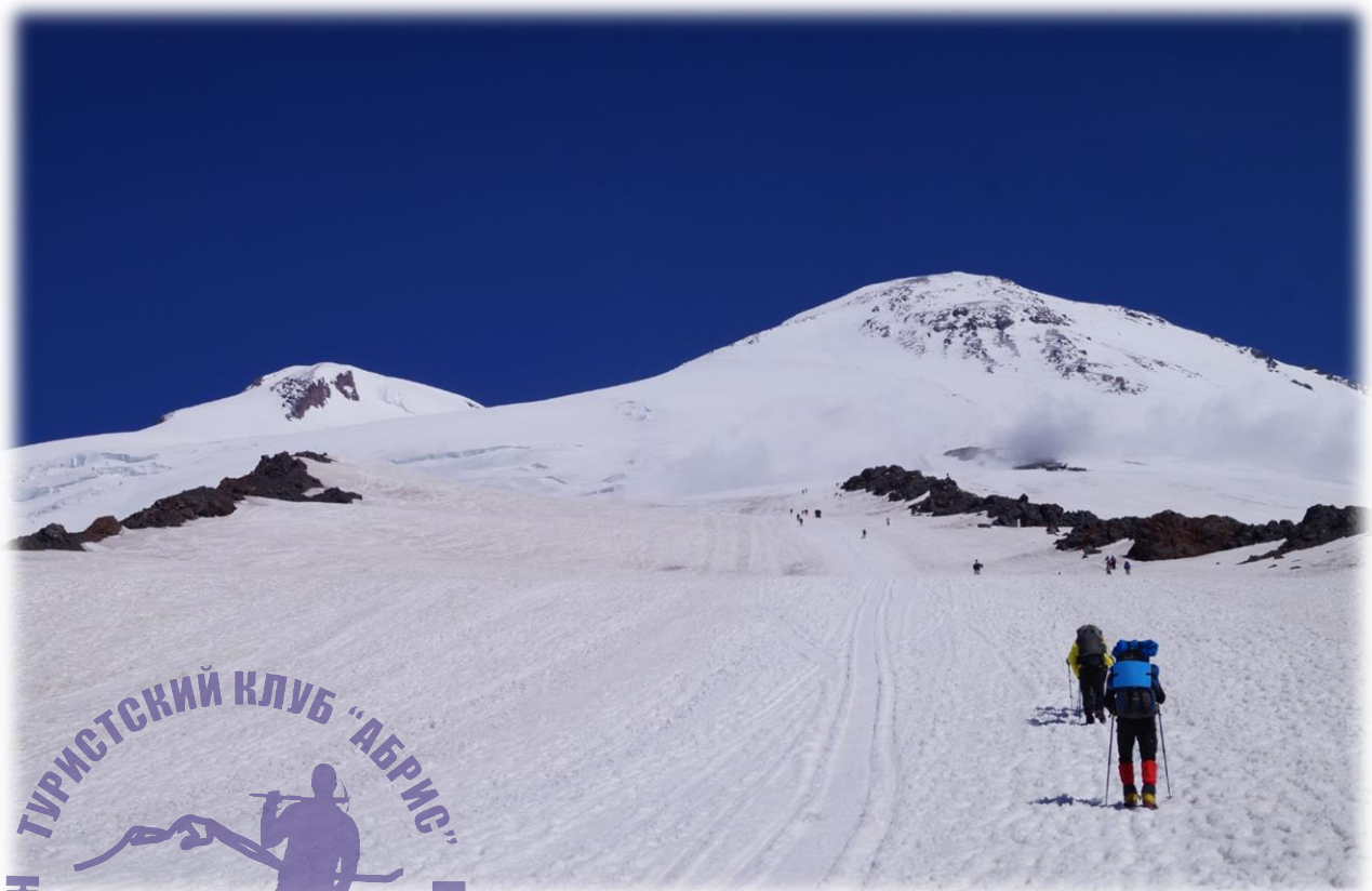
Рис.1 – южные склоны Эльбруса в ясный день.

В данной инструкции мы подготовили подробный план действий по подготовке к восхождению. После его прочтения у Вас не останется белых пятен при планировании поездки. Останется только собрать вещи и готовиться к главному приключению лета. Поехали!