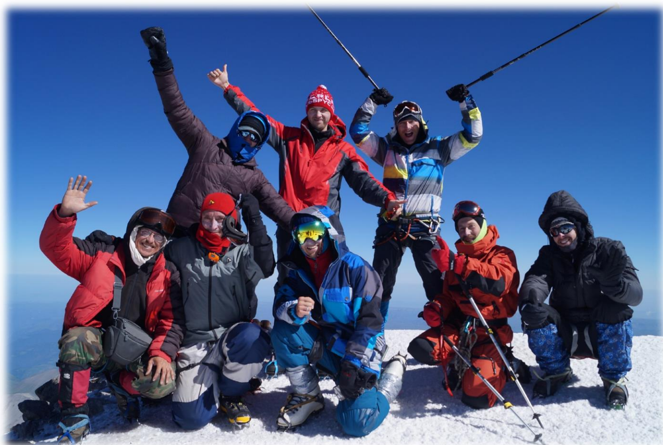
Рис. 18 – Западная вершина Эльбруса. 5642 метра.

Мы уже у Седловины, высота 5300 м, снова перекус, чай, ещё совсем немного. Вершина как на ладони, ещё чуть-чуть. Силы организма мобилизуются, резервные запасы включаются в работу, финальный рывок... ВЕРШИНА!!! Ну, здравствуйте, вожделенные 5642 м!!!