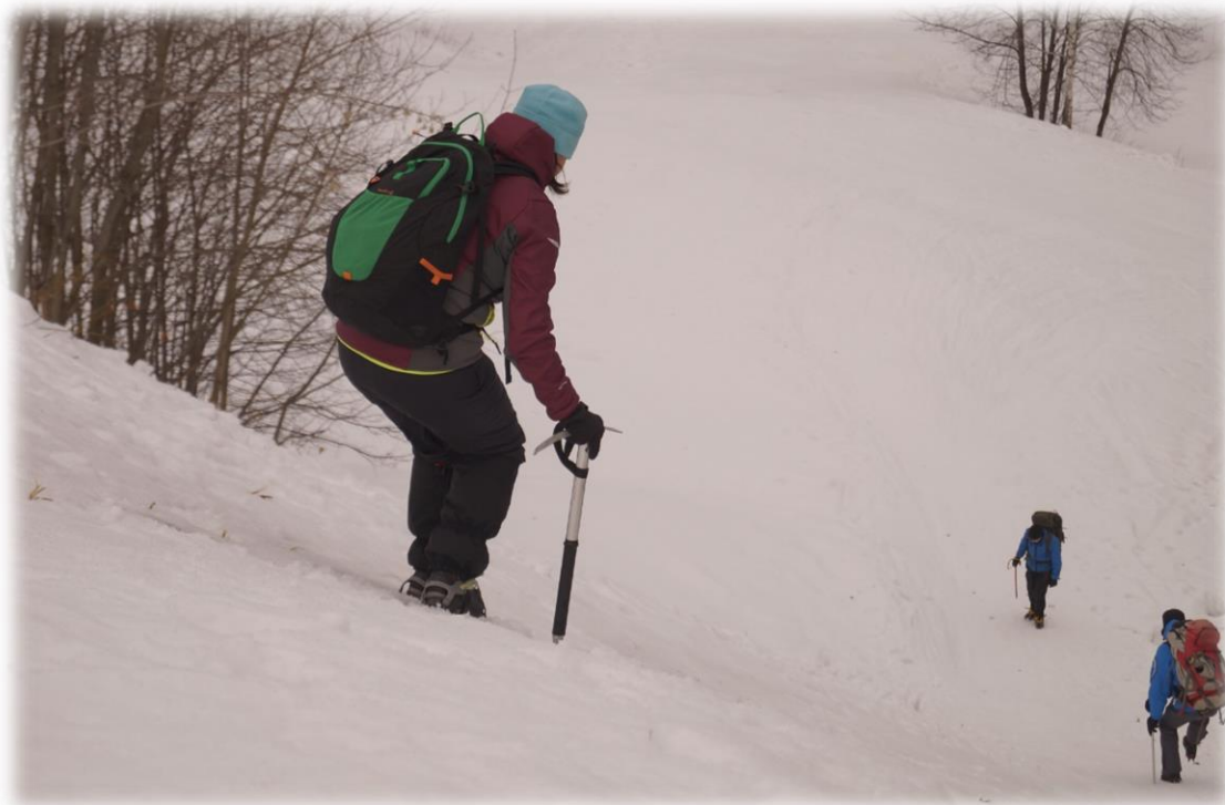
Рис.3 – группа наших курсантов, тренирующаяся в парке «Швейцария».

Для всех желающих мы устраиваем бесплатные консультации, посвященные вопросам экипировки и подготовки к восхождениям, принять участие в которых могут все желающие, вне зависимости от того с кем, как и когда они планируют отправиться в горы.