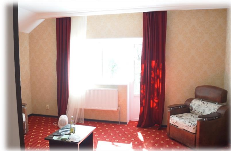
Рис. 21 а, б – одна из комнат номера «Люкс» в отеле «Азау Премьер» (слева), санузел в номере стандарт того же отеля (справа).

Условия размещения в Терсколе или на Азау зависят от варианта тарифа: «Базовый», «Комфорт» или «Опционный» (в рамках которого Вы сами выбираете условия проживания).