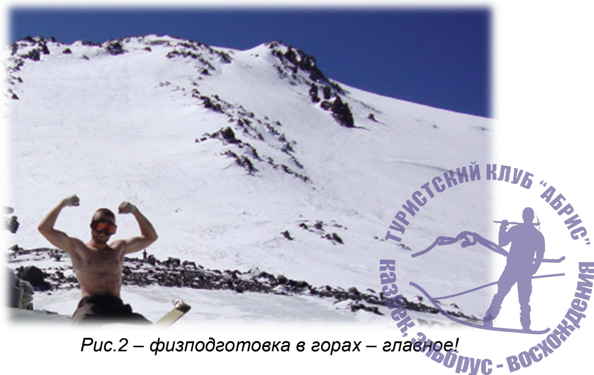
Рис.2 – физподготовка в горах – главное!

И помните, что всё это мы делаем для того, чтобы восхождение было в удовольствие, а не превратилось в испытание на грани жизни и смерти.