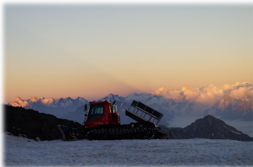
Рис.16 – Ратрак у приюта «Мария», 4150 м.

Скалы Пастухова – это уже серьёзная высота, которая расставляет всё по своим местам, либо ты готов, либо нет. И обратно в приют.