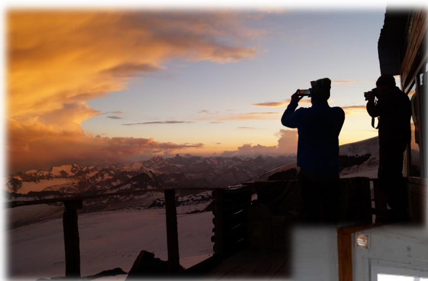
Рис. 12-14 – Приют «Мария», 4100 м.