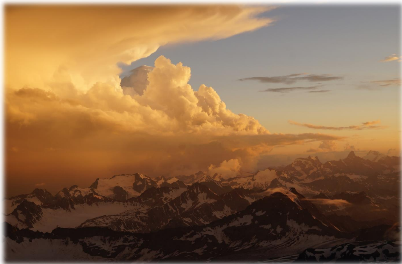
Рис.20 – Горы... Вид от приюта «Мария».

Мы уверены, что этот день будет одним из счастливо-радостных дней в Вашей жизни, ведь Вы возвращаетесь домой покорителем самой высокой точки Европы. Но неумемная тоска по Горам, которые Вы покидаете, откладывает некоторый оттенок грусти. И Вы внутренне обещаете себе вернуться... Может монетку кинуть?..