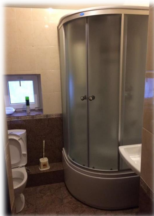
Рис. 21 г – номер стандарт в Отеле «Седьмой регион».