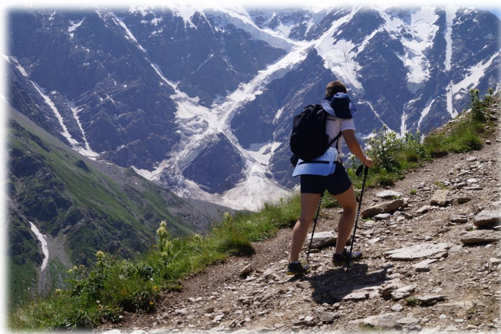
Рис.8 – Подъём по тропе на Чегет. Ледник «Семёрка».

Продолжаем акклиматизацию, всё внимание на неё! Стартуем к Чегету. И вот так, шаг за шагом, кадр за кадром, постепенно приближаемся к вершине, где впервые, в полный рост видим ЕГО. Огромный, величественный, манящий Эльбрус, ради которого всё и затевалось.