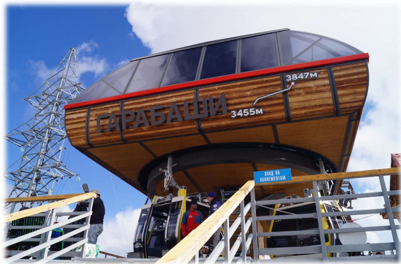
Рис.11 – Станция «Гара-Баши», 3847 м.

Рюкзак на плечи, высокогорные ботинки на ноги, вперед к подъемникам. Повсюду надписи, что «в Европе выше не катаются», впрочем, в Европе выше и не восходят. После заселения в приют (4150 м) для лучшей акклиматизации прогуляемся на 500 м вверх, до начала скал Пастухова.