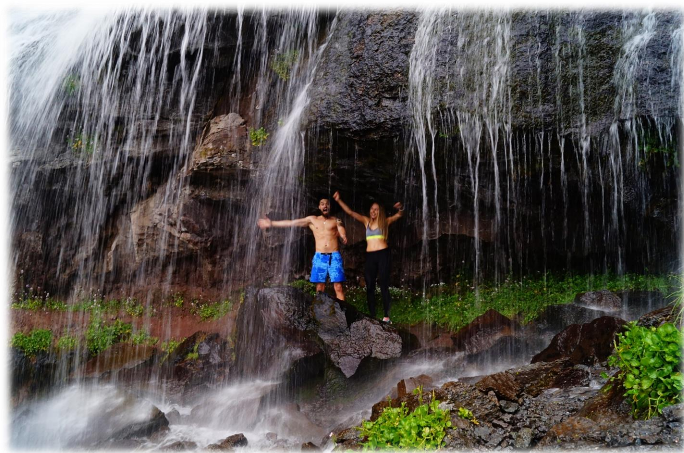
Рис.7 – По дороге на Обсерваторию. Водопад «Девичьи косы».

Приятным бонусом в этой прогулке-восхождении будут не только потрясающие пейзажи, но и ВОДОПАД «Девичьи косы», высотой около 30 метров! Зрелище поистине потрясающее!