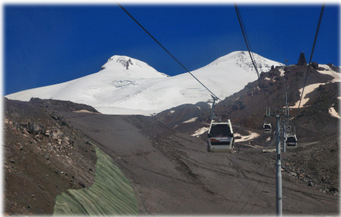
Рис. 10 – Канатная дорога, 2-я очередь. Справа вверху – станция «Мир».

Постепенно повышаем высоту акклиматизации. Сегодня преодолеем рубеж в 4 км! Утром, как только канатная дорога начинает работу, поднимаемся на станцию «Мир», расположенную на высоте 3455 м. Здесь уже вовсю ощущается высокогорье. Голые камни и скалы, с ледников, испещрённых трещинами, веет холодом. До «бочек» поднимемся пешком по каменистой дороге, а затем, надев кошки, поучимся ходить по льду.