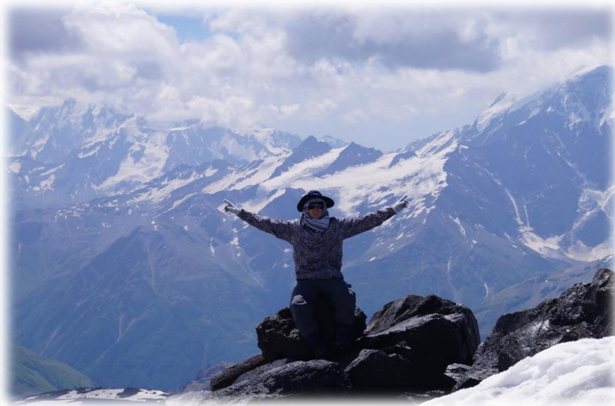
Рис.15 – на скалах Пастухова, 4600 м.

Продолжаем акклиматизационные вылазки. Необходимое снаряжение в рюкзак, рюкзак на себя, выдвигаемся! Поднимаемся до скал Пастухова.