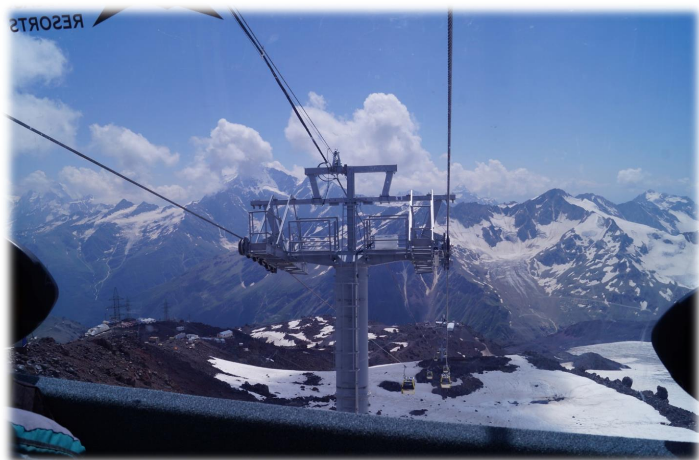
Рис. 17 – Вид из кабинки канатной дороги.

Можно даже спуститься на Азау, подышать перед восхождением кислородом. Но запомните: никаких кафе и ресторанов! Не стоит рисковать Вершиной из-за несвежего салата!