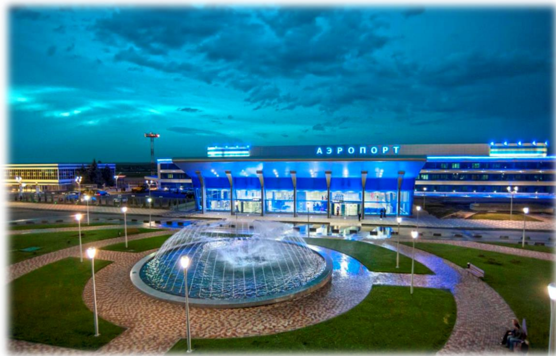
Рис.6 – фонтан у входа в аэропорт Минеральных Вод.

Аэропорт Минеральных вод, высота над уровнем моря 314 м.